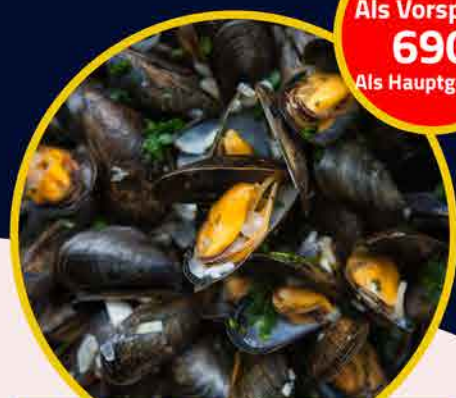
Mussels "French Bistro" Muscheln "Pariser Bistro"